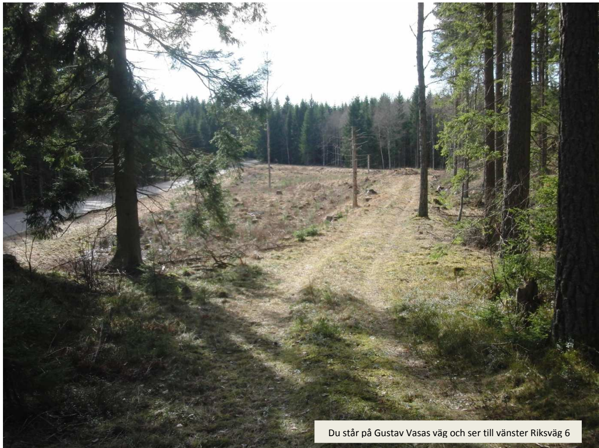
Du står på Gustav Vasas väg och ser till vänster Riksväg 6

Resor från Hova till Laxå gav strapatser ända in i 1930-talet. Hästarna tappade skor och vagnsaxlar bröts av i "Bergebacken", "Gubbelätta", "Käringstreta", "Brinkebackarna" och upp mot Posseborga.