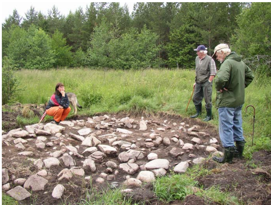
En bit av vägen avtorvad

Vägen sträcker sig mellan domarringarna och en plats som i orten benämns Kung Stenkils borg. Arbetet fortsätter här tillsammans med Moholms Hbf.